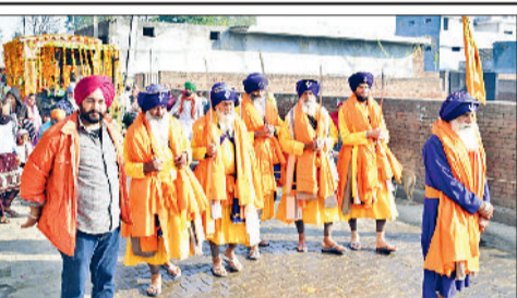
सीवन। नगर कीर्तन की अगुवाई करते पंज प्यार।