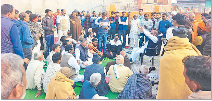
डांड। गांव का नाम बदलने के विरोध में एकत्रित हुए ग्रामीण।

मुख्यमंत्री ने राज्यस्तरीय कार्यक्रम में गांव का नाम बदलने की घोषणा की थी