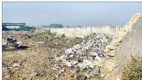
कलायत। सफाई से जुड़ी व्यवस्था की मुंह बोलती तस्वीरें।

कलायत नगरपालिका के साथ-साथ अब कैथल, कुरुक्षेत्र व जिला करनल में डोर टू डोर सफाई व्यवस्था पर जांच के सवाल उठने लगे हैं। यह मामला इस बार विधानसभा सत्र के पटल पर भी पहुंचा। इसी कड़ी में स्वच्छ भारत से जुड़े मामले में भारी अनिश्चतता और