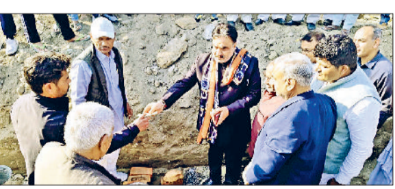
जीद। चौपाल की नींव रखते हुए डिप्टी स्पीकर डा. कृष्ण मिश्रा।

हरियाणा विधानसभा के डिप्टी स्पीकर डा. कृष्ण मिश्रा ने अहिरका गांव में नई चौपाल के निर्माण कार्य की नींव रख शिलान्यास किया। इस अवसर पर उन्होंने इस विकास कार्य के लिए 31 लाख रुपये की धनराशि स्वीकृत की। डिप्टी स्पीकर ने कहा कि राय सरकार ग्रामीण क्षेत्रों के विकास को सर्वोच्च प्राथमिकता दे रही है। गांवों में आधारभूत सुविधाओं को और सुदृढ़ करने के