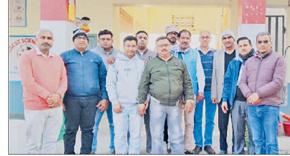
कलायत। जिला शिक्षा अधिकारी के आदेशों के खिलाफ विरोध जताते शिक्षक।