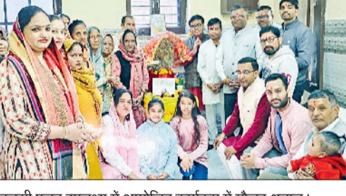
कलायत। तुलसी पूजन उपलक्ष्य में आयोजित कार्यक्रम में मौजूद श्रद्धालु।