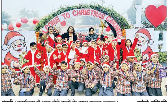
पूडरी। कार्यक्रम में भाग लेते बच्चों के साथ स्कूल स्टाफ।

इसमें नजर आया। बच्चों के चेहरों पर उत्साह और खुशी देखते ही बनती थी। कार्यक्रम की शुरुआत प्रार्थना सभा से हुई। जिसमें बच्चों ने क्रिसमस से जुड़े गीत गाए और प्रभु यीशु मसीह के संदेश, प्रेम, करुणा और भाईचारे को याद किया। इसके बाद सांस्कृतिक कार्यक्रम प्रस्तुत किए गए। नन्हे विद्यार्थियों ने कविता पाठ, नृत्य, कार्ड और छोटे-छोटे नाटकों के माध्यम से क्रिसमस का महत्व दर्शाया। कार्यक्रम का विशेष आकर्षण यह रहा कि बच्चे विभिन्न देशों के व्यंजन अपने साथ लाए। इस गतिविधि का उद्देश्य बच्चों को अलग-अलग देशों की संस्कृति और खानपान से परिचित कराना था। सभी बच्चे एक साथ बैठ कर,