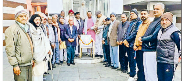
जीद। पूर्व प्रधानमंत्री को नमन करते ब्राह्मण सभा सदस्य।