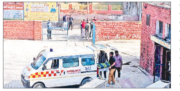
जींद। मृतका के शव का पोस्टमार्टम करा जाते जाते परिजन।

रूप नगर में संदिग्ध हालात के चलते महिला ने फांसी का फंदा लगा कर आत्महत्या कर ली। शहर थाना पुलिस ने मृतका के पिता की शिकायत पर आरोपित पति के खिलाफ दहेज हत्या का मामला दर्ज किया है। पुलिस मामले की जांच कर रही है।