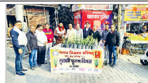
भावि पदाधिकारी आमजन को तुलसी पौधे वितरित करते।