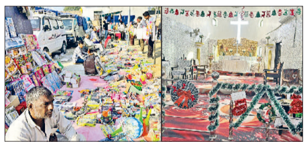
राजौद। खरीददारी करते हुए लोग व सजी हुई चर्च का दृश्य।