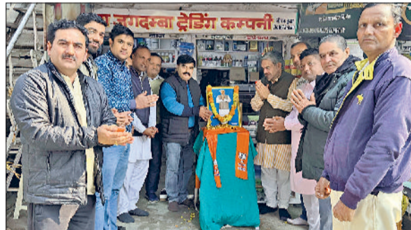
पूंडरी। पूर्व प्रधानमंत्री अटल बिहारी वाजपेयी के चित्र पर पुष्पांजलि अर्पित करते हुए।