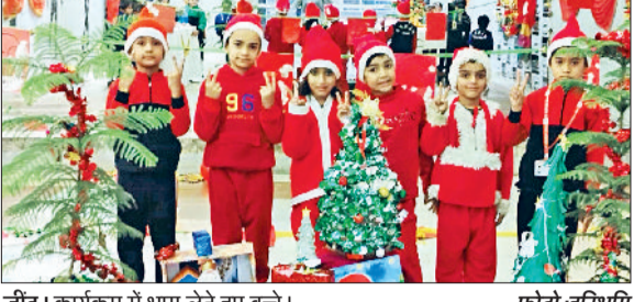
जीद। कार्यक्रम में भाग लेते हुए बच्चे।