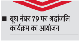
हरिभूमि न्यूज >> पूंडरी